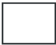
4 LADOS - 20mm