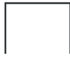
3 LADOS - 20mm