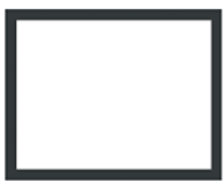
4 LADOS - 45mm