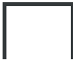
3 LADOS - 45mm