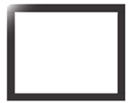
4 LADOS VIDRO - 50mm