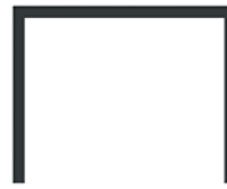
3 LADOS - 45mm