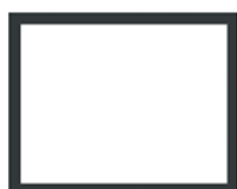
4 LADOS - 45mm