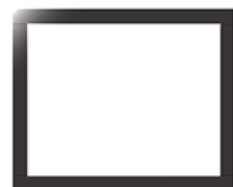
4 LADOS VIDRO - 50mm