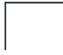
3 LADOS - 20mm